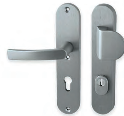
Kování vstupních dveří